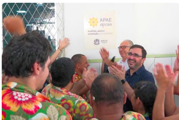
Inauguração do programa APAE Apoia