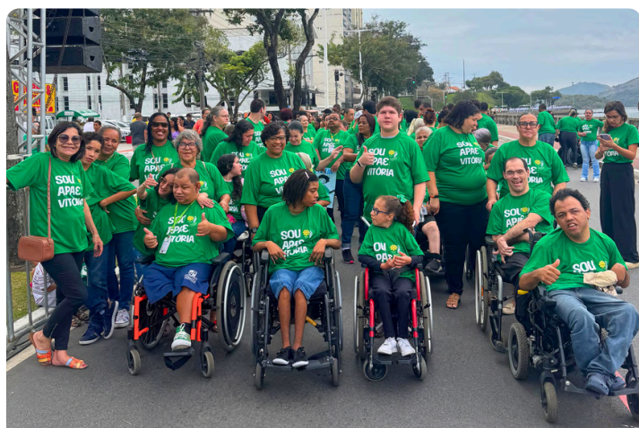
Desfile Cívico do 7 de setembro