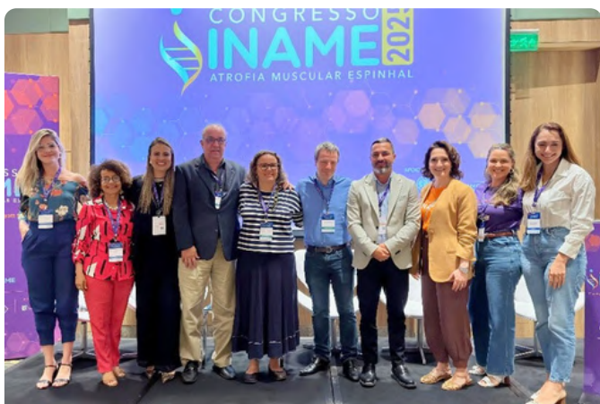
Participação no Congresso INAME 2025