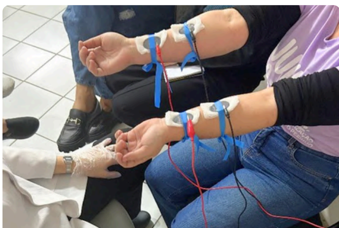
Capacitação sobre o Teste do Suor para equipe do CEDAB