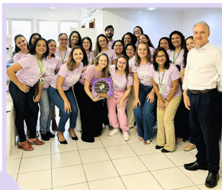
Campanha Junho Lilás