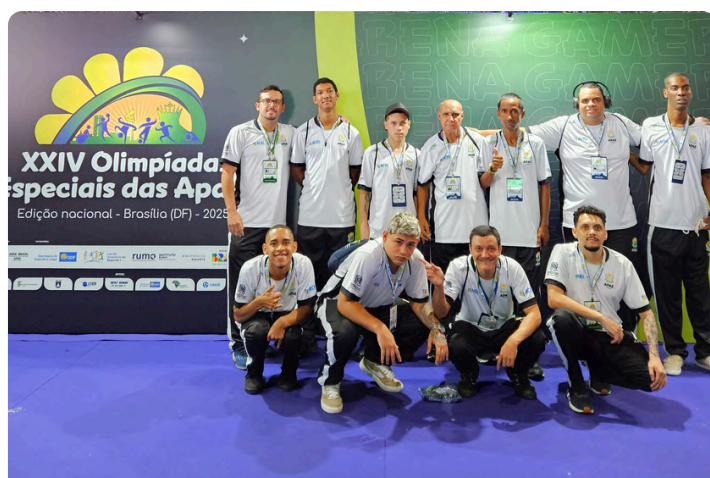
Olimpíadas Especiais das Apaes