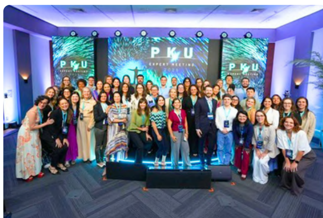
Participação do Evento PKU Expert Meeting