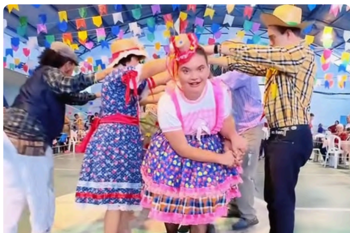
60tão APAE Vitória