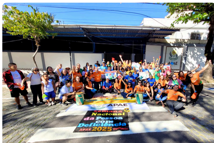
Semana da Pessoa com Deficiência