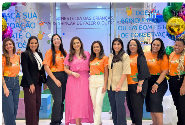
Campanha A Loja de Brinquedos Vazia