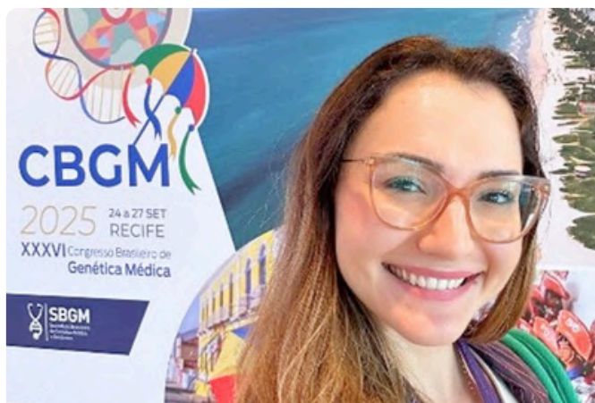
XXXVI Congresso Brasileiro de Genética Médica e Reunião do Serviço de Referência em Doenças Raras